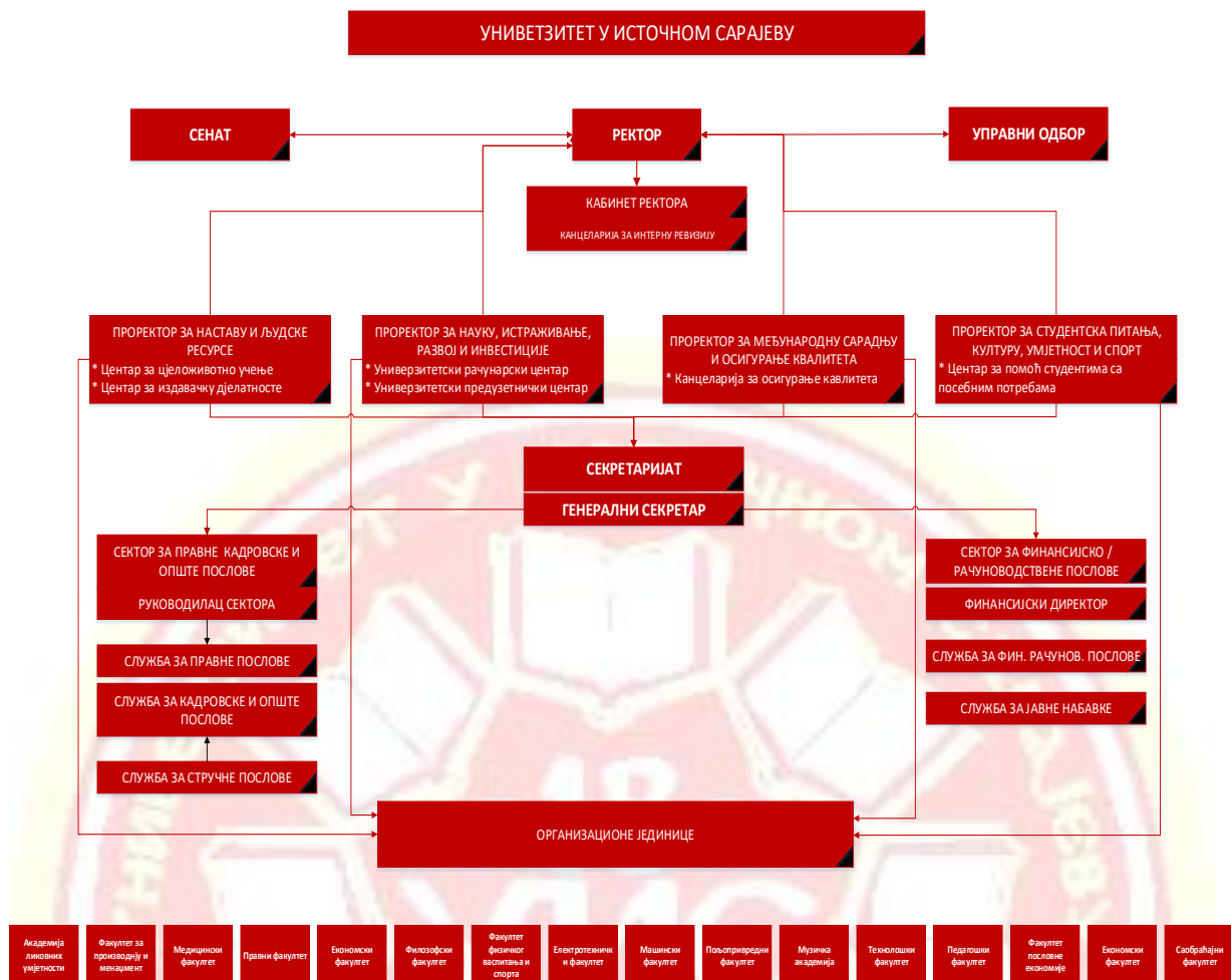
Слика 2. Организациона структура