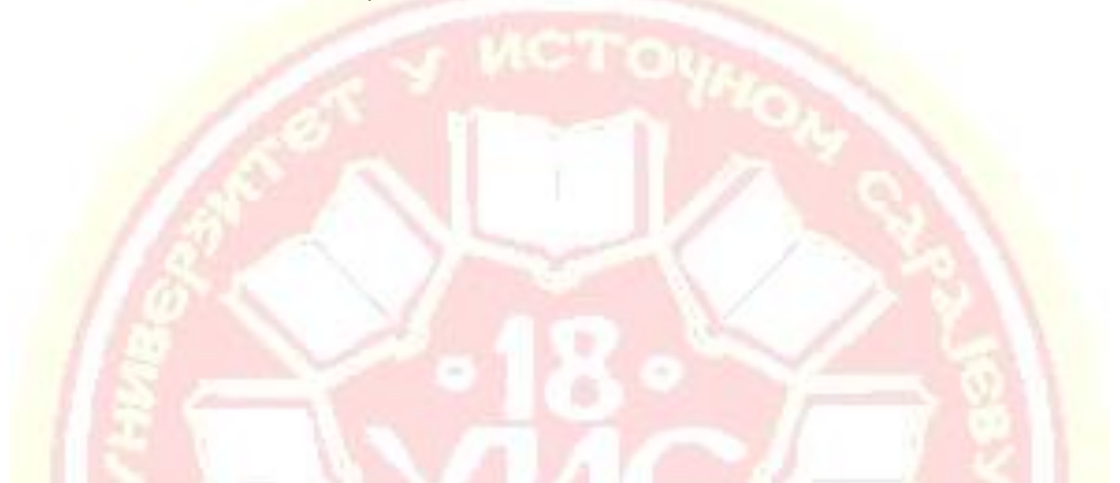
Табела 1. SWOT анализа Универзитета

SWOT анализа (приказана у табели 1) представља инструмент стратегијског планирања који садржи у себи два битна елемента и то: спољашњу анализу Могућности и Пријетњи, и унутрашњу анализу Снага и Слабости. Приликом анализе спољашњег окружења, односно приликом идентификације могућности и пријетњи израђена је PEST анализа, односно Универзитет је анализиран из контекста политичких, економских, друштвених, демографских и технолошких фактора. Приликом унутрашње анализе снага и слабости шире су сагледани сви сегменти функционисања Универзитета заједно са препорукама екстерне комисије за акредитацију Универзитета идентификованих у извјештају о екстерној евалуацији Универзитета.